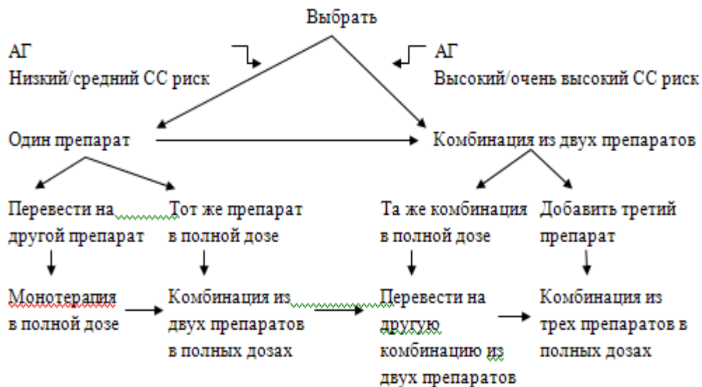
Таблица 8 – Рекомендации по выбору рациональных и возможных комбинаций антигипертензивных препаратов для лечения больных артериальной гипертензией в зависимости от клинической ситуации